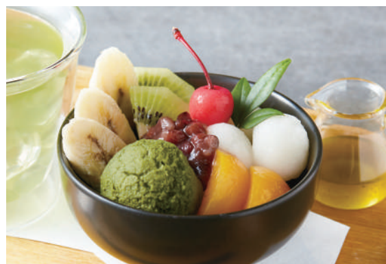
フルーツあんみつ w/ 抹茶アイス

Mitsumame Topped w/Bean Jam, Matcha Ice Cream & Fruits