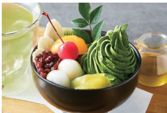
宇治抹茶ソフトクリーム あんみつ

Mitsumame Topped w/Bean Jam, Matcha Soft Serve Ice Cream & Fruits