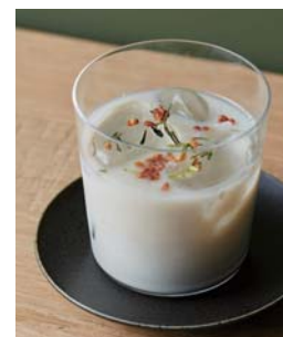
Virgin Green Tea Sangría