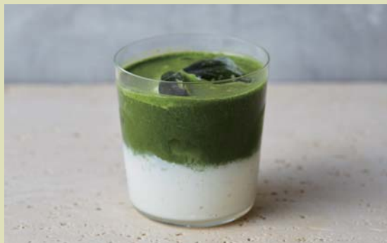
Matcha Latte (hot/Iced)

single 850 (TAX in 918) double 950 (TAX in 1,026)